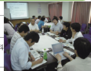
セミナーのようす