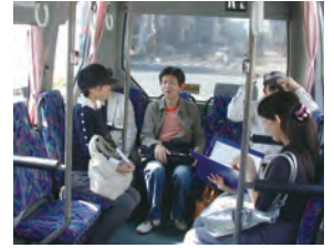
大阪市交通局「赤バス」現地調査(2008)