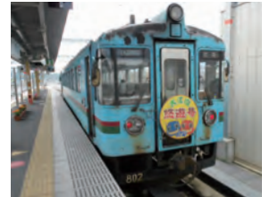
KTR北近畿タンゴ鉄道 現地調査(2011)