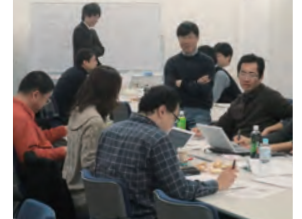
ラーニング・ファシリテーターが参加者の発想、議論をサポート