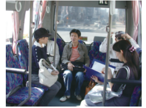
大阪市交通局「赤バス」現地調査(2008)