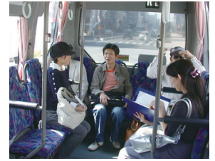
大阪市交通局「赤バス」現地調査(2008)