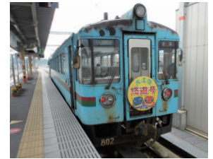
KTR北近畿タンゴ鉄道 現地調査(2011)