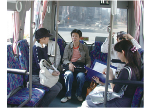
大阪市交通局「赤バス」現地調査(2008)