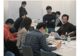
ラーニング・ファシリテーターが参加者の発想、議論をサポート