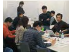
ラーニング・ファシリテーターが参加者の発想、議論をサポート