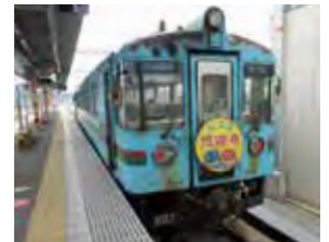
KTR北近畿タンゴ鉄道 現地調査(2011)