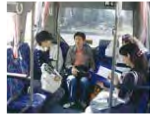
大阪市交通局「赤バス」現地調査(2008)